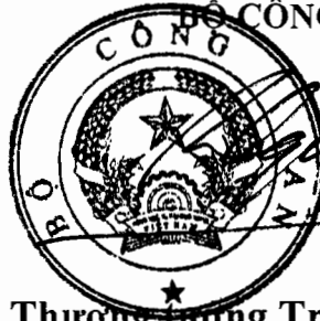
Thượng tướng Trần Đại Quang